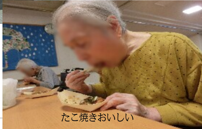
たこ焼きおいしい