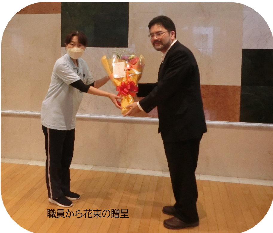
職員から花束の贈呈

今年も11月1日に社会福祉法人養珠会の創立記念日を迎えました。ご利用者さまとともにささやかながら創立記念日を祝いました。