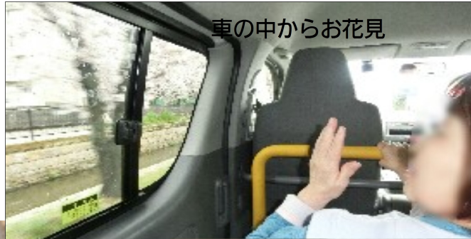
車の中からお花見

一昨年より猛威を振るうコロナ禍の中、ご利用者さまの「安心」と「安全」に気を配りつつ楽しいひと時をお過ごしいただけるよう職員一同工夫を凝らしております。